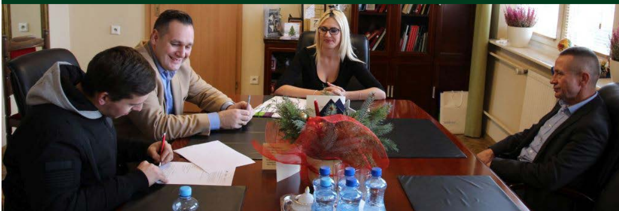
Edukacja za Bony. Podpisywanie umów w ramach wsparcia finansowego "Bony Na Szkolenia"

w ramach poddziałania 3.2.1 oraz 3.2.2 współfinansowany ze środków EFS w ramach RPO Województwa Podlaskiego na lata 2014-2020, Osi Priorytetowej III Kompetencje i kwalifikacje, Działanie 3.2 Kształtowanie i rozwój kompetencji kadr regionu