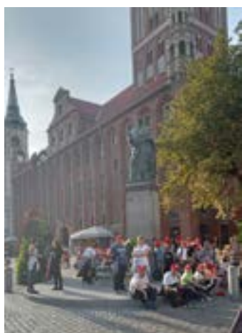
nym punktem programu był udział w warsztatach pierni-

Z wielką radością powitano Filusia – niewielką rzeźbę znanego z komiksów psa Filusia z parasolką i jego pana, profesora Filutka. Następ-