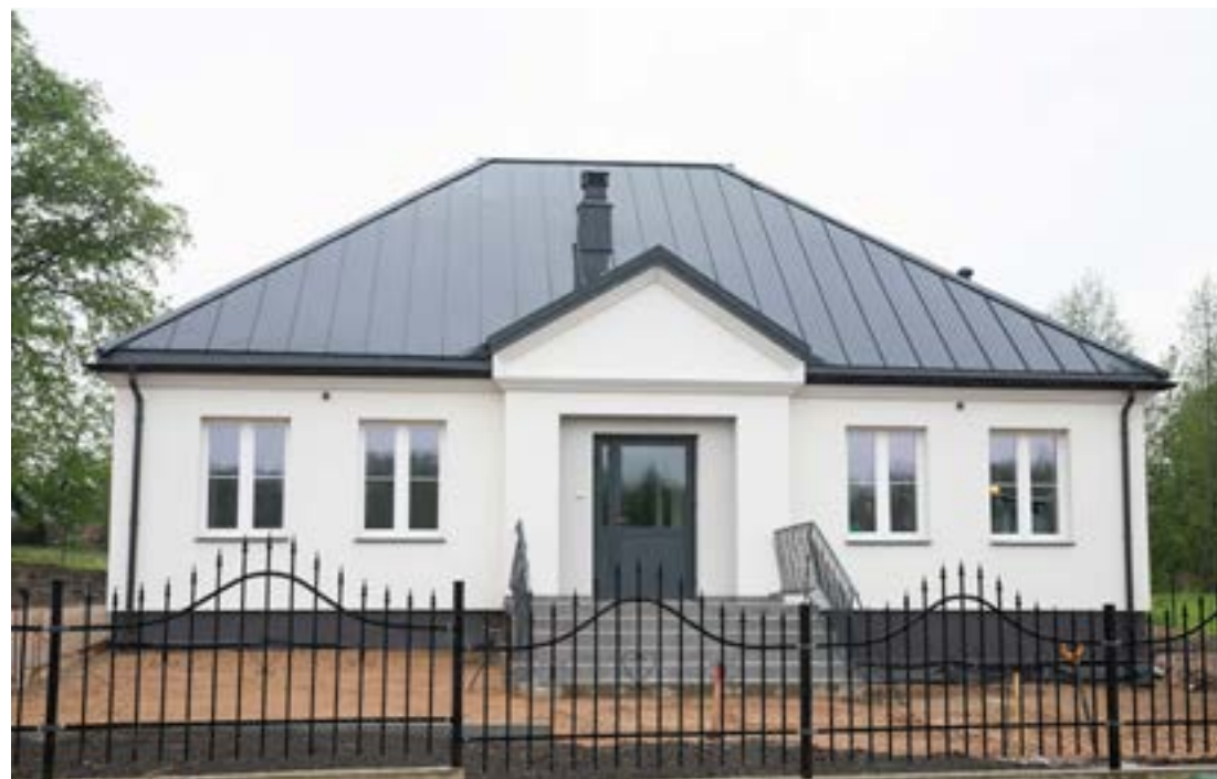
Placówka opiekuńczo-wychowawcza „Promyk” w Czuprynowie

Staraniem Starosty na terenie Powiatu Sokólskiego powstały już dwie placówki opiekuńczo-wychowawcze typu rodzinnego. Znajdują się one w Czuprynowie i Choruzowcach. Kolejna będzie się mieścić w Kuźnicy, a jej otwarcie nastąpi