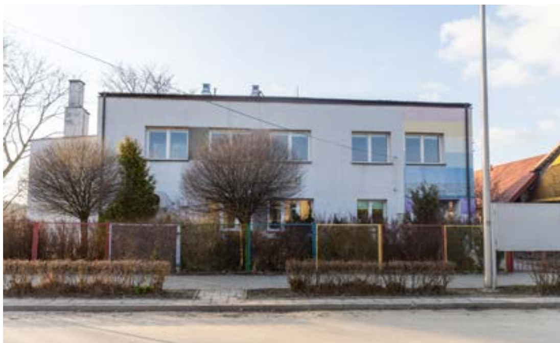
Placówka opiekuńczo-wychowawcza „Perełka” w Kuźnicy

podłogi, zamontowano instalację ogrzewania podłogowego wraz z pompą ciepła oraz panele fotowoltaiczne. Dachy zostały pokryte blachą, wstawiono też brakujące okna i odnowiono elewację. Poza tym zagospodarowano przestrzeń wokół nich. Znajdują się tam teraz nowiutkie place zabaw, co stwarza dzieciom jeszcze bardziej przyjazne warunki do zabawy i rekreacji.