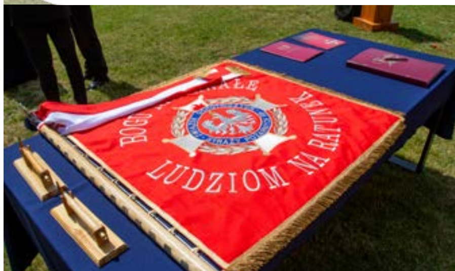
OSP Wierzchlesie ma nowy sztandar