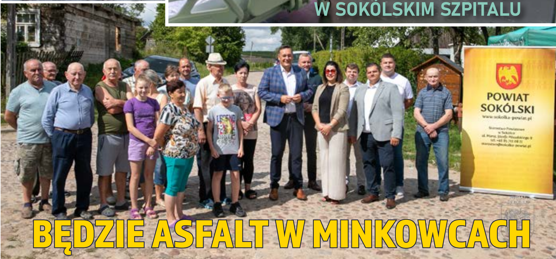
BĘDZIE ASFALT W MINKOWCACH